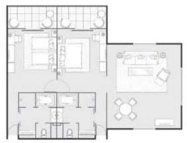
2ベッドルームスイート