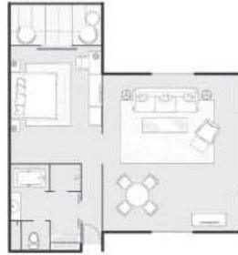
1ベッドルームスイート